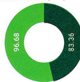
Net Asset Value (NAV) Per Share